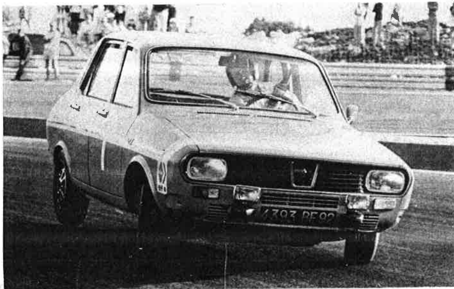
Une attitude caractéristique de la R 12 Gordini qui n'est pas sans rappeler certaines Mini Cooper S